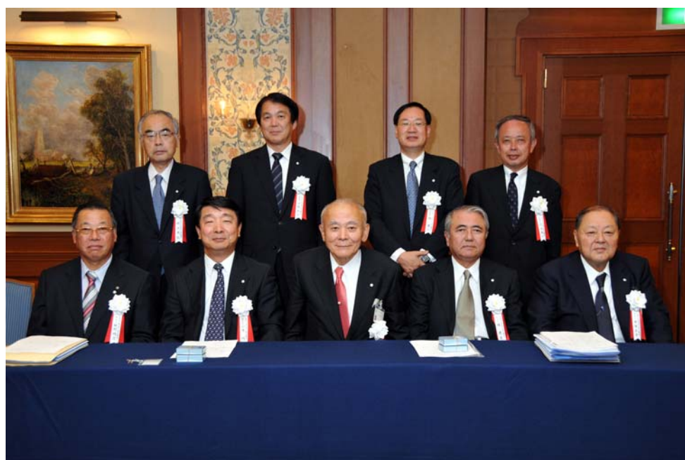
前列左手から 牧野特別顧問（相談役）、小寺副会長、川本会長、椿副会長、米田特別顧問（相談役） 後列左手から 村上参与、河野常務、林専務、河合常務