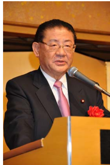
自由民主党LPG対策議員連盟 山崎 拓会長