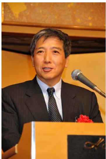
経済産業省原子力安全・保安院 薦田康久院長