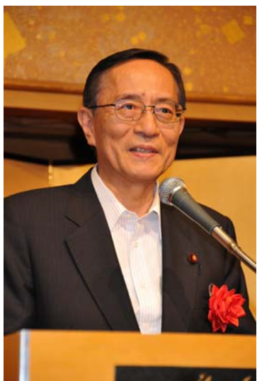
自由民主党 細田博之幹事長