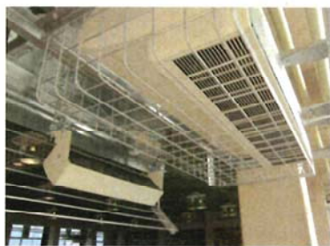
体育館のエアコン設置

災害時に早期に供給可能なL P ガス対応のガスヒートポンプエアコンと発電機の設置。