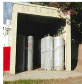
L P ガスの保管状況