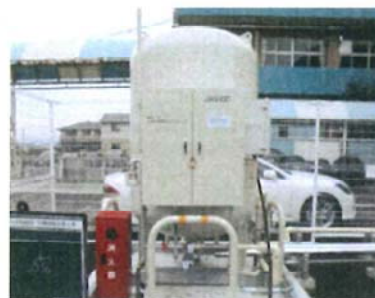
災害対策用バルクユニット

*災害対策用バルクユニット：L P ガスを大量に蓄える貯槽（980kg～985kg）とガスメーター、圧量調整器、ガス栓が一体となった設備である。