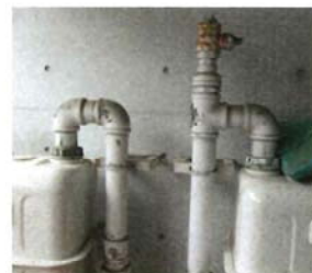
ガス変換器の接続口